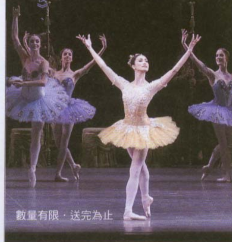
數量有限，送完為止

訂就送：NSO《傳奇·世紀》音樂會票券、美國芭蕾舞團《開幕之夜》 《夜姬》演出票券等，獨家優惠方案。 本月訂閱獨家優惠 速見本刊 P.140