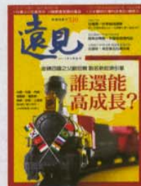
零售版封面設計 杜重儀