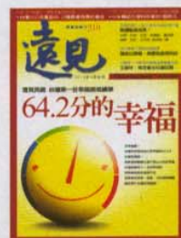
訂戶版封面設計 劉麗堅