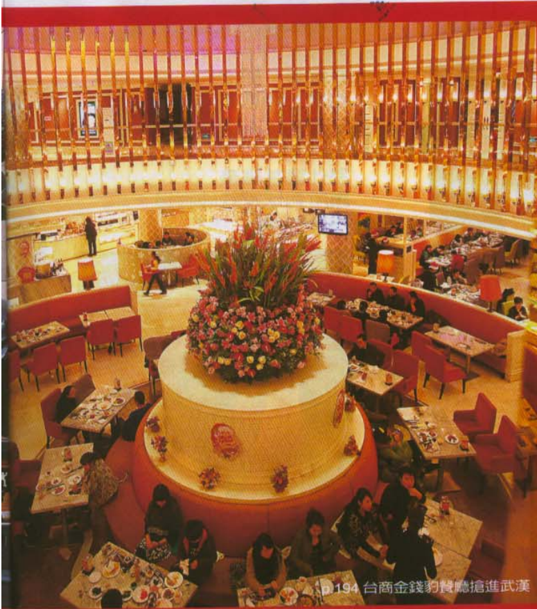
p.194 台商金錢豹餐廳搶進武漢